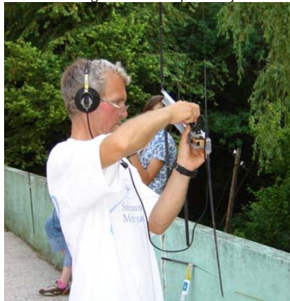
Tehnički pregled goniometra