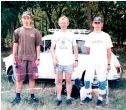
Sombor 2001. godine