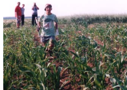
Sombor 2001. godine – kroz kukuruze

Prihvatio je veoma teške zahteve savremenog ARG-a od strane IARU, pa se oprobava u orijentingu i atletici. U obe aktivnosti postiže rezultate na domaćim, međunarodnim i stranim manifestacijama