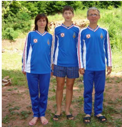
Grza 2006. godine – ekipa Kanjiže