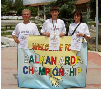
Bugarska 2006. godine 1. Balkanski ARDF ŠARG.