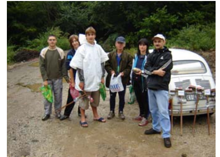
Fruška Gora 2007. – ekipa Kanjiže