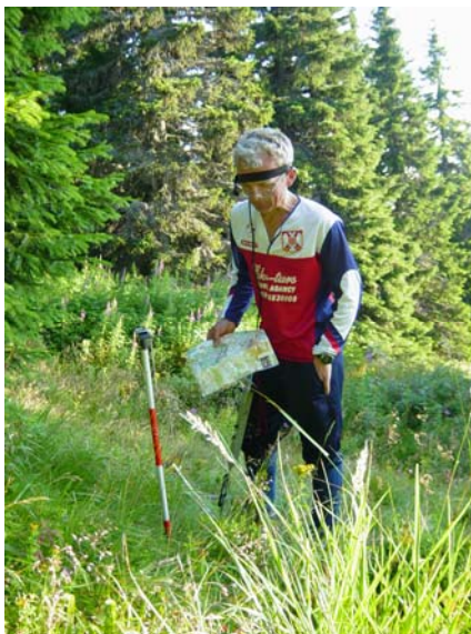
Kopaonik 2005. godine – pripreme reprezentacije