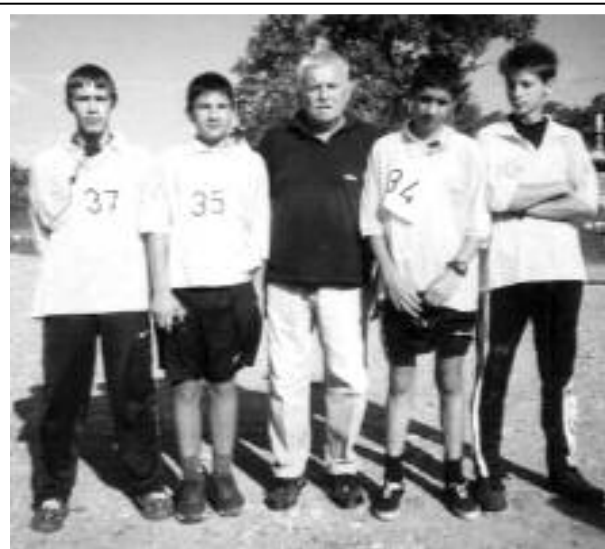
YU1AVQ Земну – Бољевци