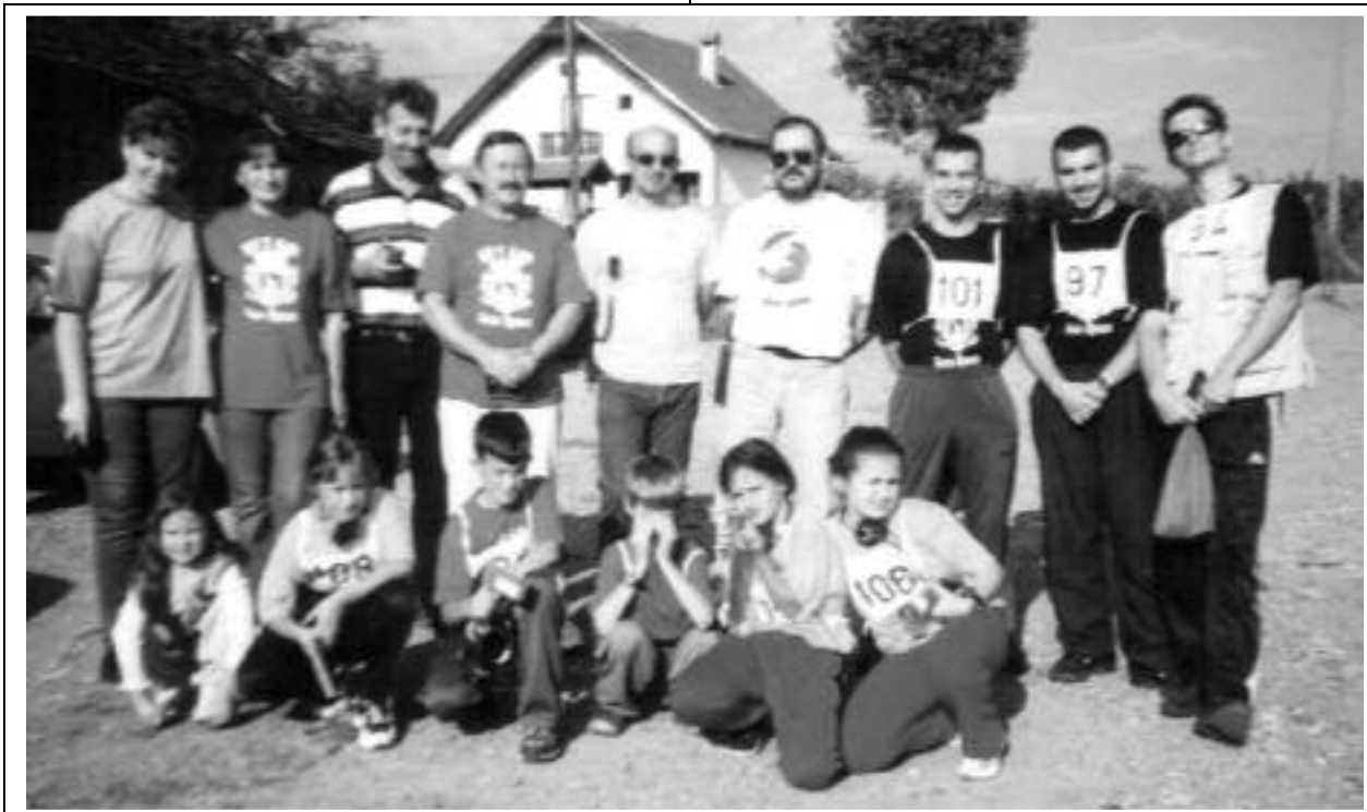
YU7AJF Бела Црква