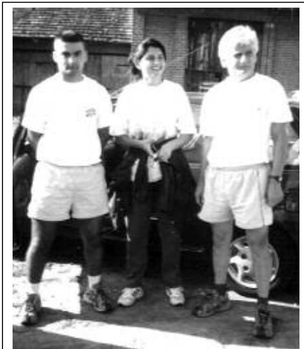
Z3 Скопље – Македонија