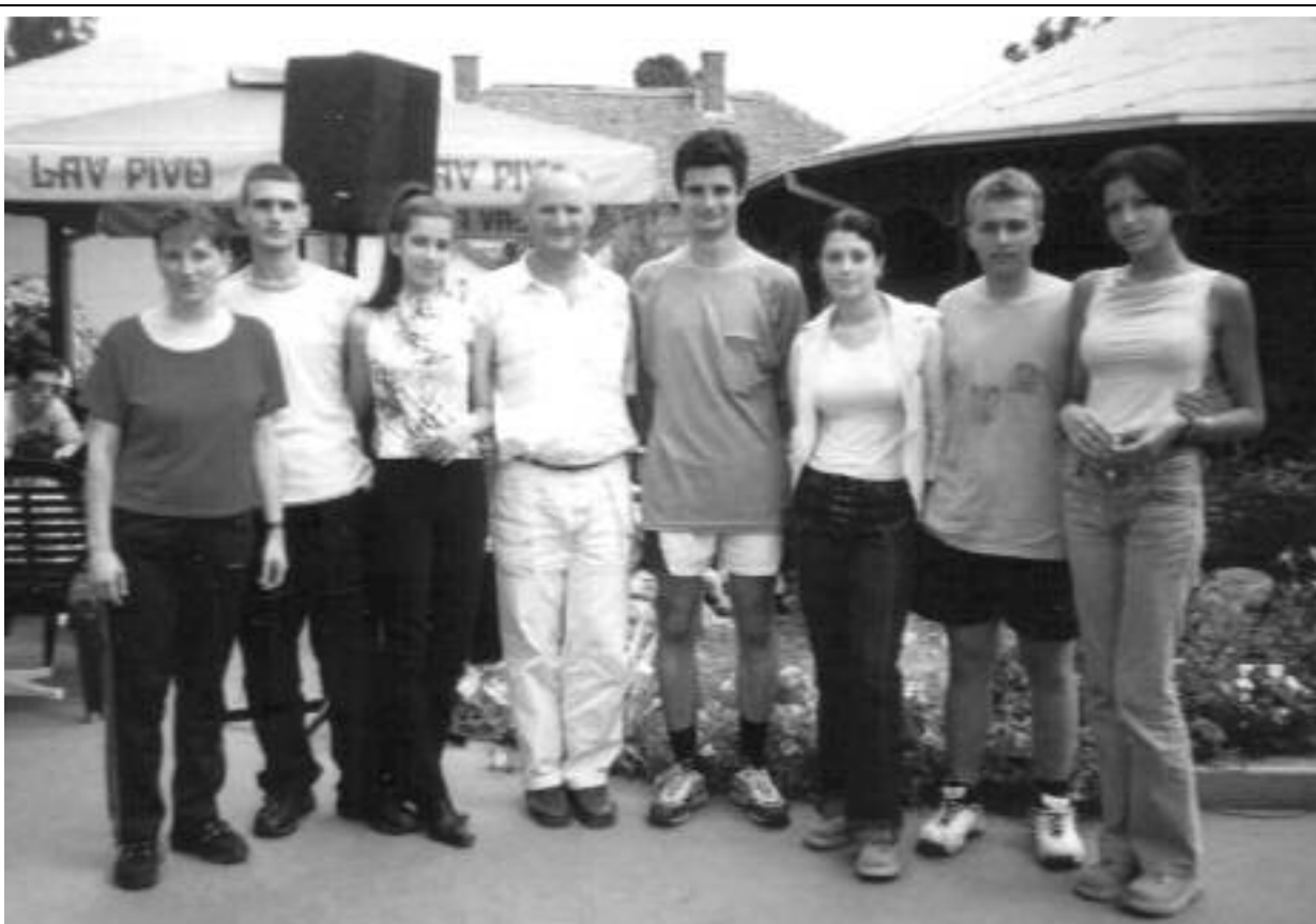
Део АРГ репрезентације СРЈ