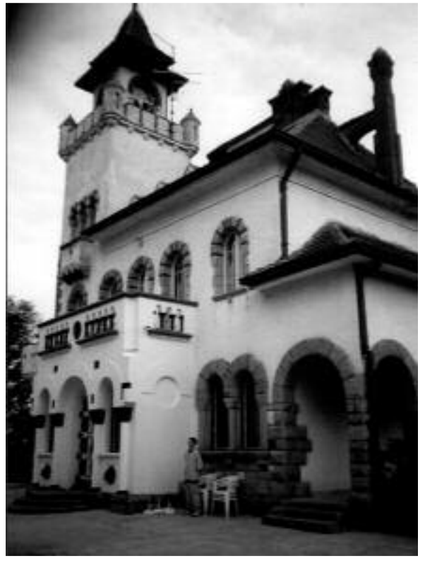
ЕПС, Електро-Исток Београд "Вила Караџић"