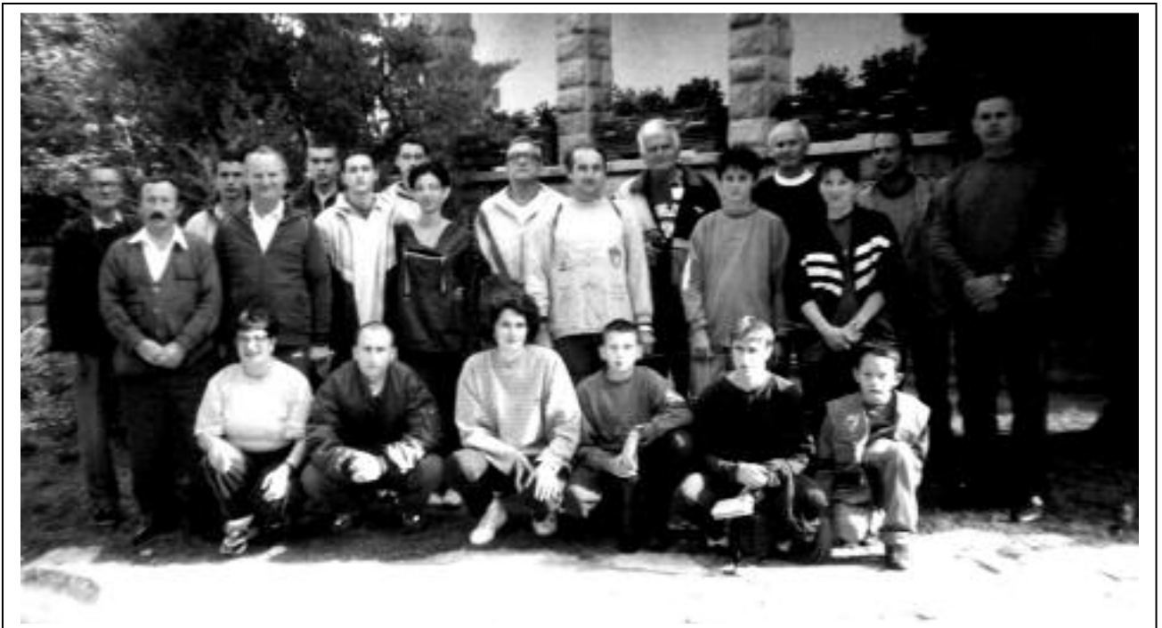
Део репрезентације YU АРГ са пратиоцима рада